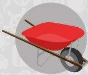
CARRINHO DE MÃO