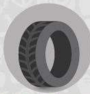
PNEUS E OUTROS AMBIENTES QUE ACUMULAM ÁGUA