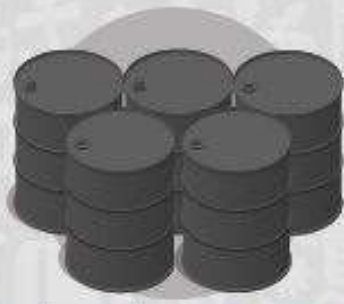
GALÕES, LATÕES, TONEL, TAMBOR, BARRIL, BALDE