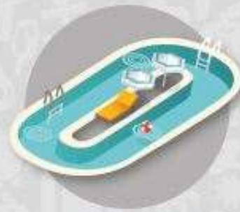
PISCINAS E FONTES