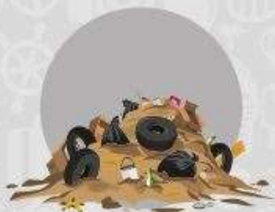
ENTULHO DE DEMOLIÇÃO