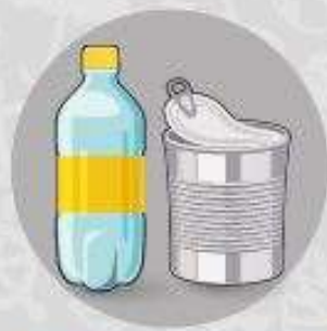
LATAS, GARAFAS E TAMPINHAS